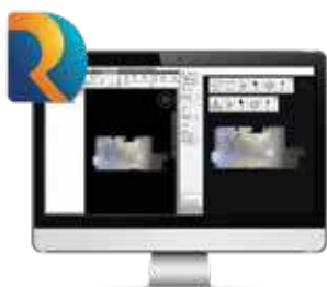
ClearEdge3D Rithm pour Navisworks®